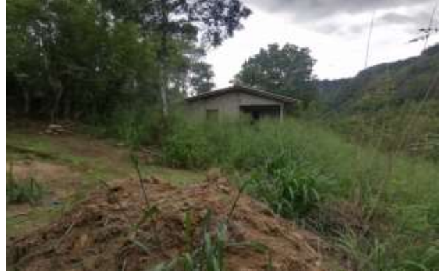
නිවාසසංවර්ධන අධිකාරිය ලබාදුන් රු.500,000 ක ණය මුදල යොදා ඉදිකර වැඩ නිම නොකළ නිවාස